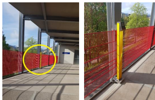
Abb. 2: Anmeldeterminale Parkebene 2 auf der linken Seite