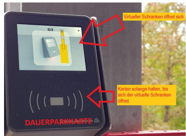
Abb.5: Abmeldevorgang in der Parkebene 2