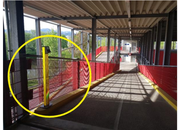
Abb. 4: Abmeldeterminal Parkebene 2 (linke Seite)