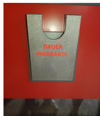
Abb. 6: Hier wird die Dauerparkkarte aus Kunststoff von oben eingeführt.