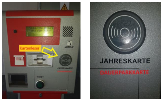
Abb. 1: Kartenleser – Schranke Erdgeschoss